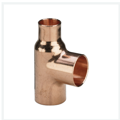
Raccordo a T Modello 95130 articolo 104 375