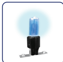
Lampada UV per la sanificazione del blocco motore