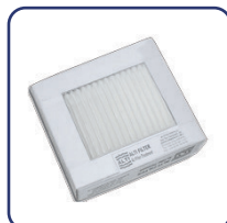
Filtro EPA E11 garantisce protezione contro il 97,66% dei batteri